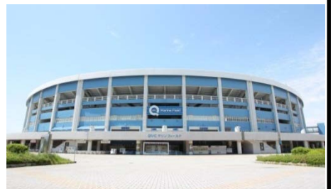
※QVCマリンフィールド