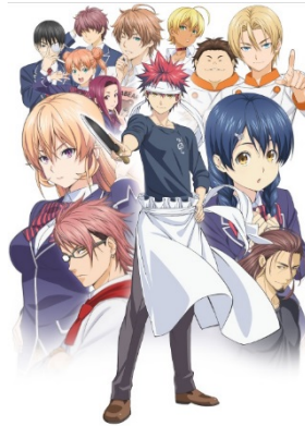
食戟のソーマ ©附田祐斗・佐伯俊／集英社・遠月学園動画研究会

1/13(土) 24:00～6:00 第1～12話 1/20(土) 24:00～6:00 第13～24話 1/27(土) 24:00～6:00 式ノ皿 全13話 2/3(土) 24:00～6:00 餐ノ皿第1～12話