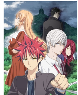
食戟のソーマ 餐ノ皿 ©附田祐斗・佐伯俊／集英社・遠月学園動画研究会