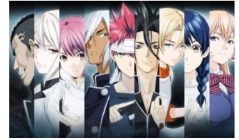
食戟のソーマ 式ノ皿 ©附田祐斗・佐伯俊／集英社・遠月学園動画研究会