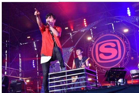
ポルノグラフィティ